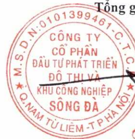
Trần Việt Dũng